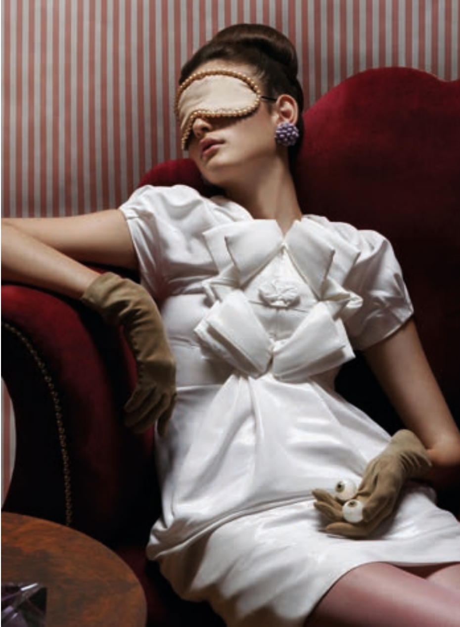
Skeletons In The Closet, 2007