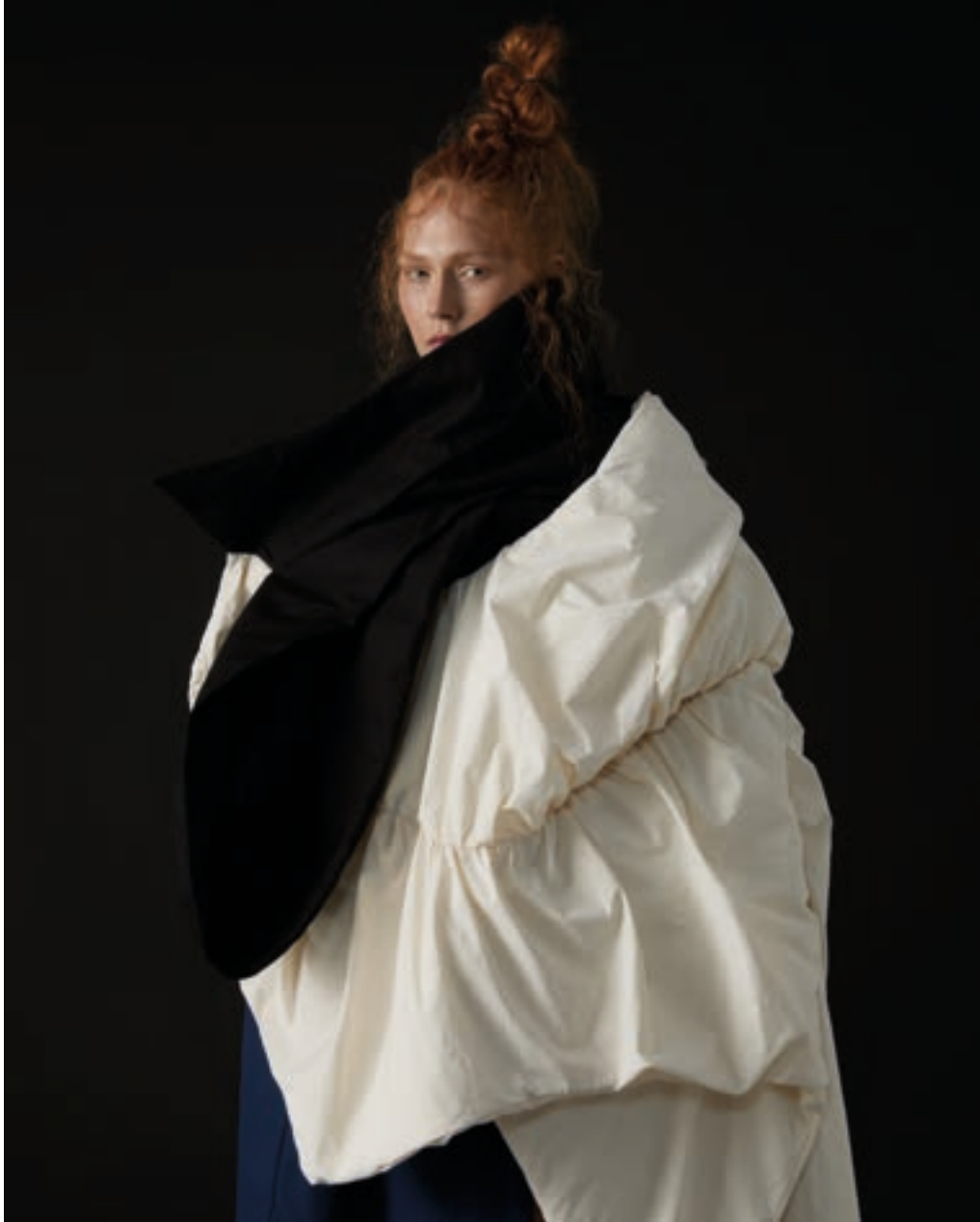
Vacuo, 2025 - Ilaria Nolli