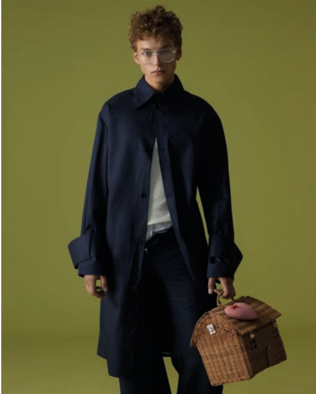
Come Segni Indelebili, 2025 – Ilaria Pansera