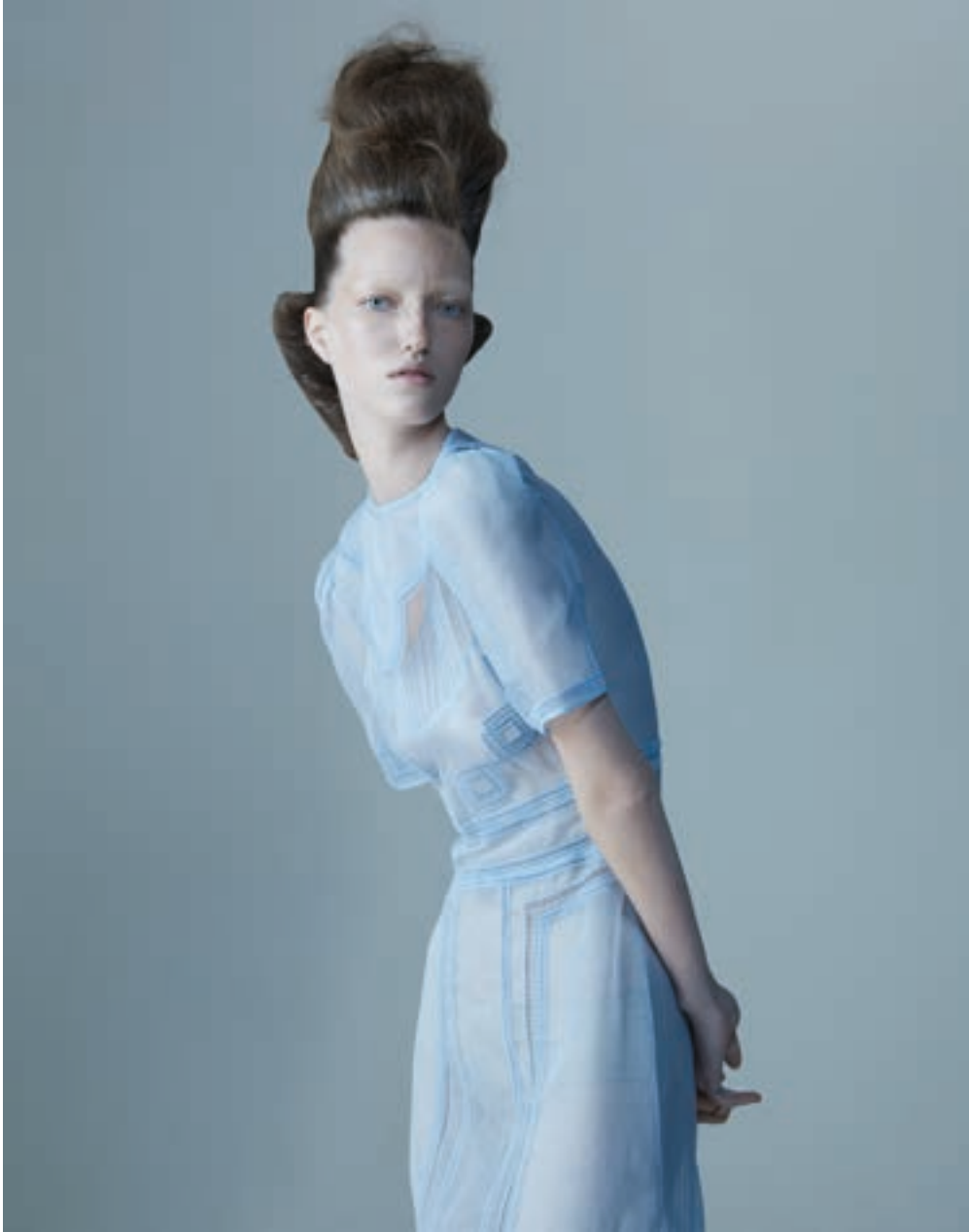
Your Highness, 2021