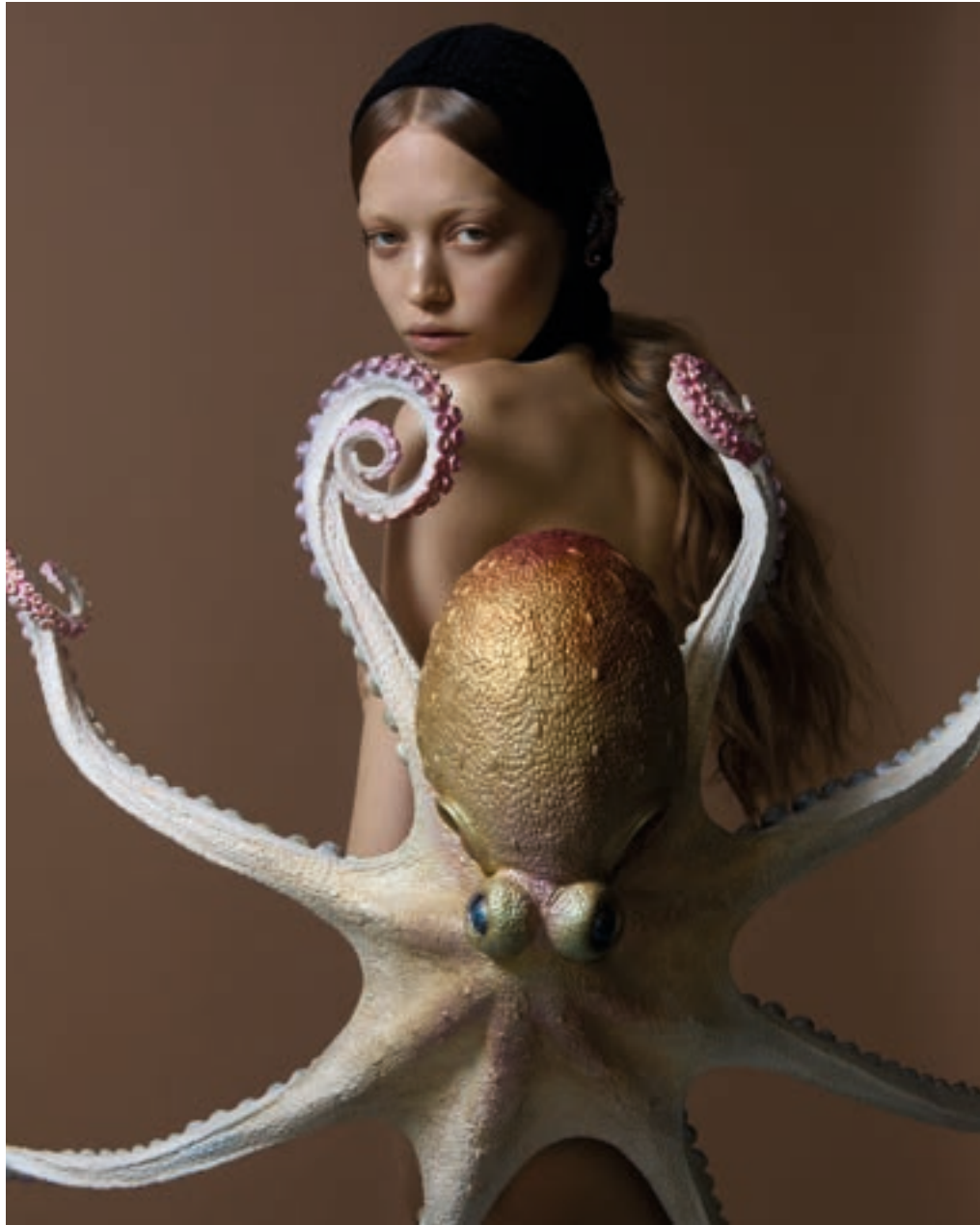
Il Bestiaire d'Amour: Cefalopodi, 2025