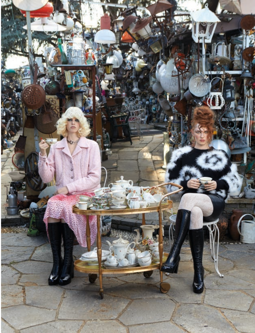
The Gilded Cage , 2023