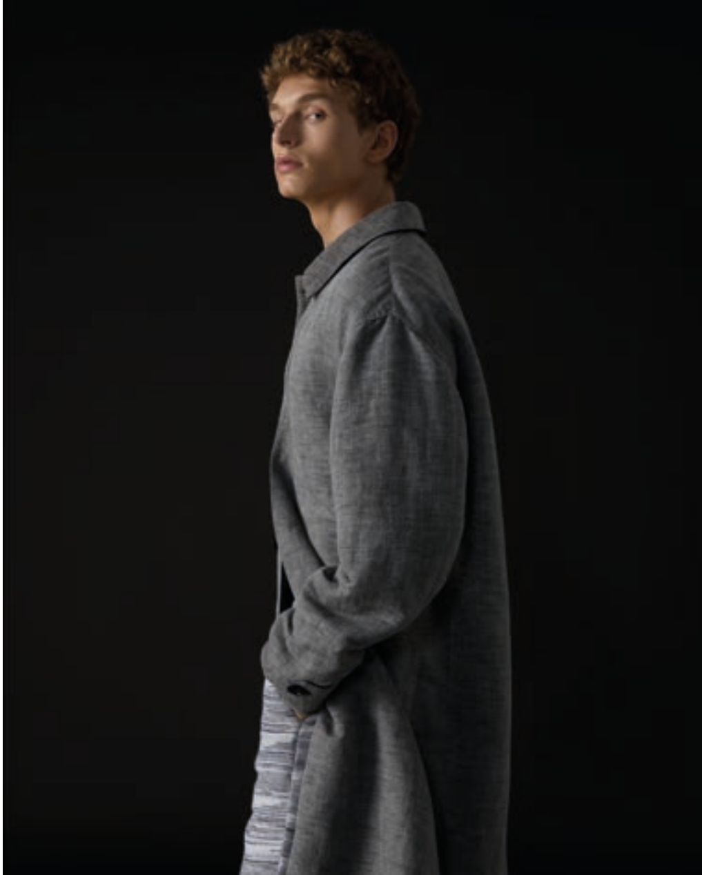
Caligo, 2025 - Vittorio Visentin