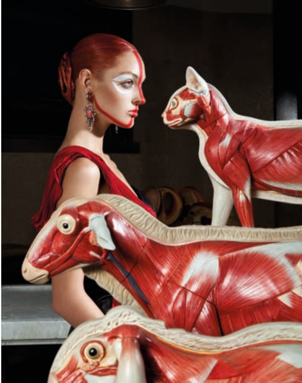
Under My Skin, 2013