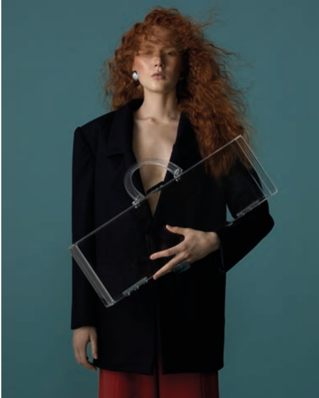
Fotopsia, 2025 - Claudia Romeo