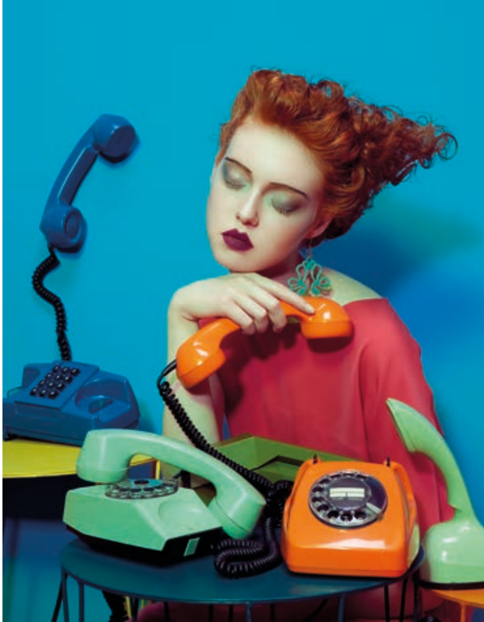
Killing Time, 2011