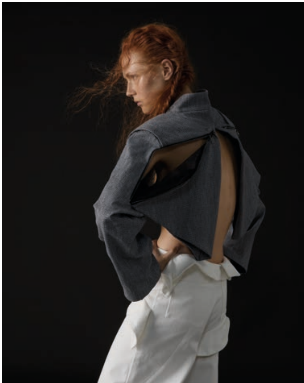
Perseveranza, Espressione del Potenziale, 2025 – Anna Bettoli